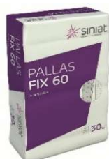
Siniat Pallas Fix 60 à 30 kg

Ansetzgips zum Ansetzen von Gips- und Verbundplatten als Wand Gipsplatten können direkt an die Wand geklebt werden.