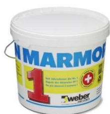
Marmoran Voranstrich G111 à 20 kg

Isolierung und Absperrung feinporiger Untergründe wie Beton, Abrieb, Gipsputz.