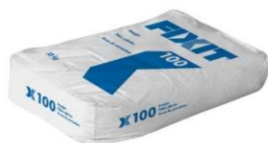
Fixit 100 à 30 kg