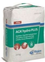
AGK hydro PLUS à 25 kg