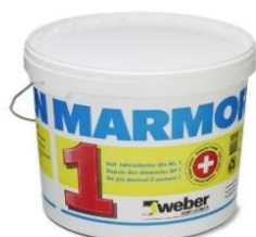
Marmoran Quars-Isoliersperre G145 à 20 kg

Isolierung und Absperrung feinporiger Untergründe wie Beton, Abrieb, Gipsputz.