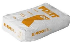
Fixit 400 à 20 kg

Remplissage de joints. Matériau de remplissage des joints. Temps de travail d'environ 40 minutes.