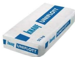
Uniflott à 5 kg oder 25 kg

Remplissage de joints. Le mastic peut être appliqué pendant environ 50 minutes avant de durcir.