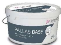
Siniat Pallas Base à 20 kg

Remplissage de joints. Peut être utilisé immédiatement pour une application manuelle.