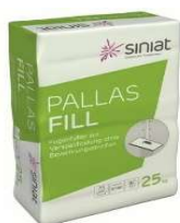
Siniat Pallas Fill à 25 kg

Remplissage de joints. Peut être utilisé immédiatement pour une application manuelle.