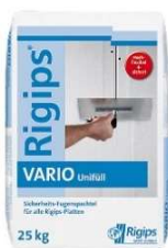
Vario à 25 kg

Remplissage de joints. Enduit de plâtre pour remplissage manuel, environ 45 min. traitable